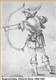
Bogenschilder, Albrecht Dürer 1500-1502